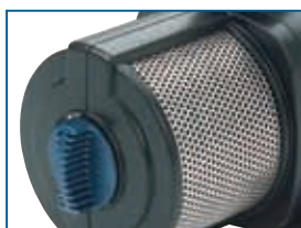
Neptun 3000–12000 Régulateur de débit et panier en acier inoxydable.