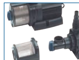
Neptun 3000–12000 Buse d'aspiration et régulateur