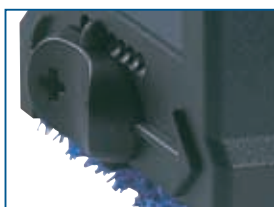
Neptun 440 Régulateur de débit

A partir de Neptun 5000 toutes les pompes peuvent être réglées électroniquement.