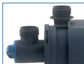
Neptun 600–2000 Buse d'aspiration et régulateur